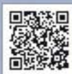
Video Steeler NG 65S Li Janne (Seteeler Yachts)